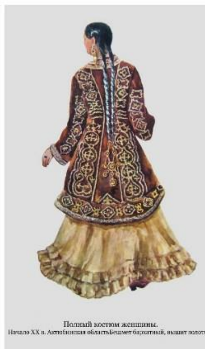
Польный костюм женщины. Начало XX в. Астанинская область. Бешмет баулатный, вышит золотом.