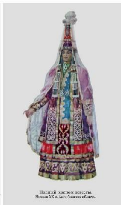
Полный костюм песты. Начало XX в. Астанинская область.