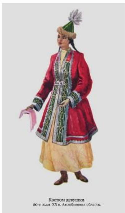
Костюм девушки. 90-е годы XX в. Астанинская область.